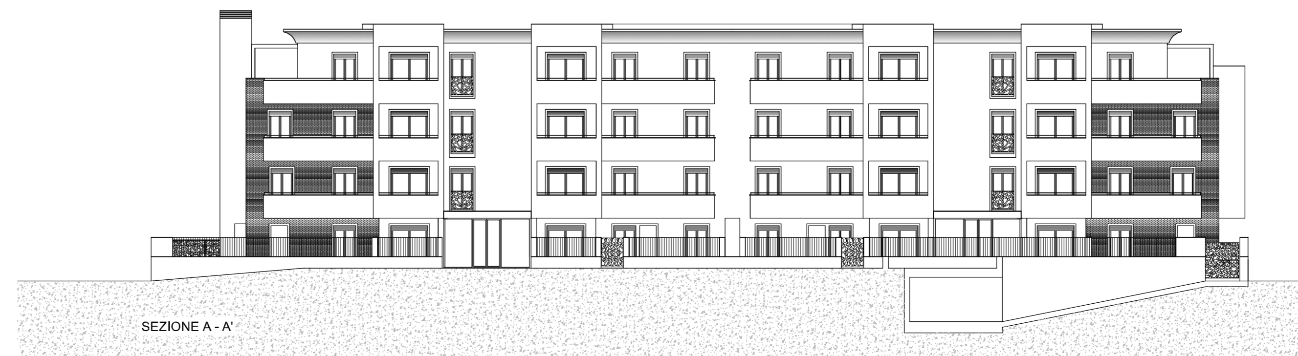
SEZIONE A - A'