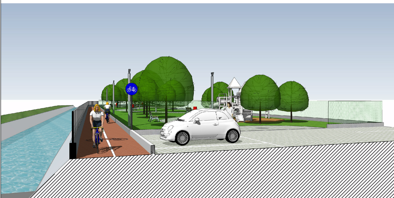
Particolare vista Sezione F-F'