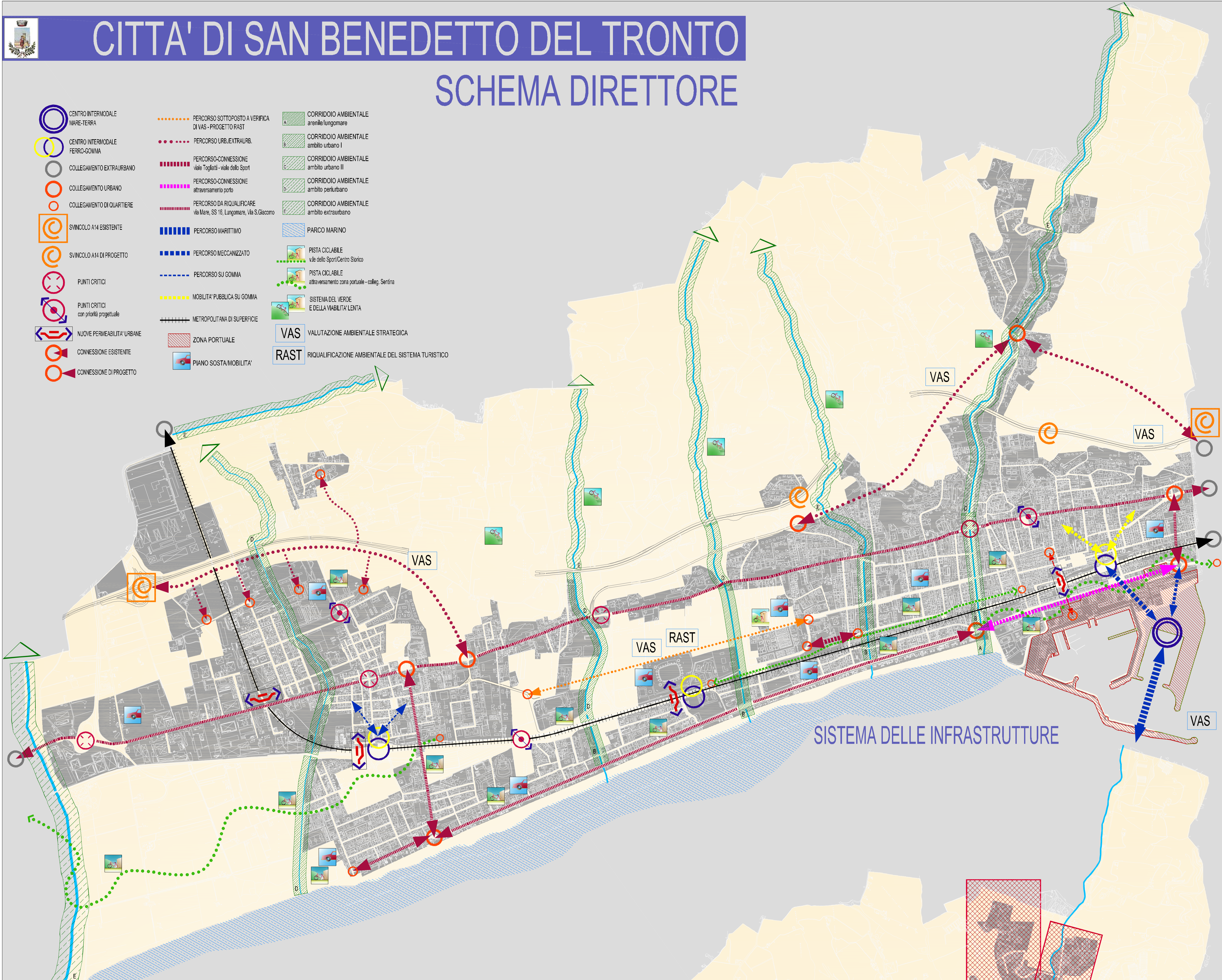
SISTEMA DELLE INFRASTRUTTURE