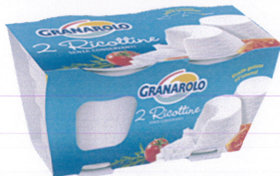
Foto unità di consumo