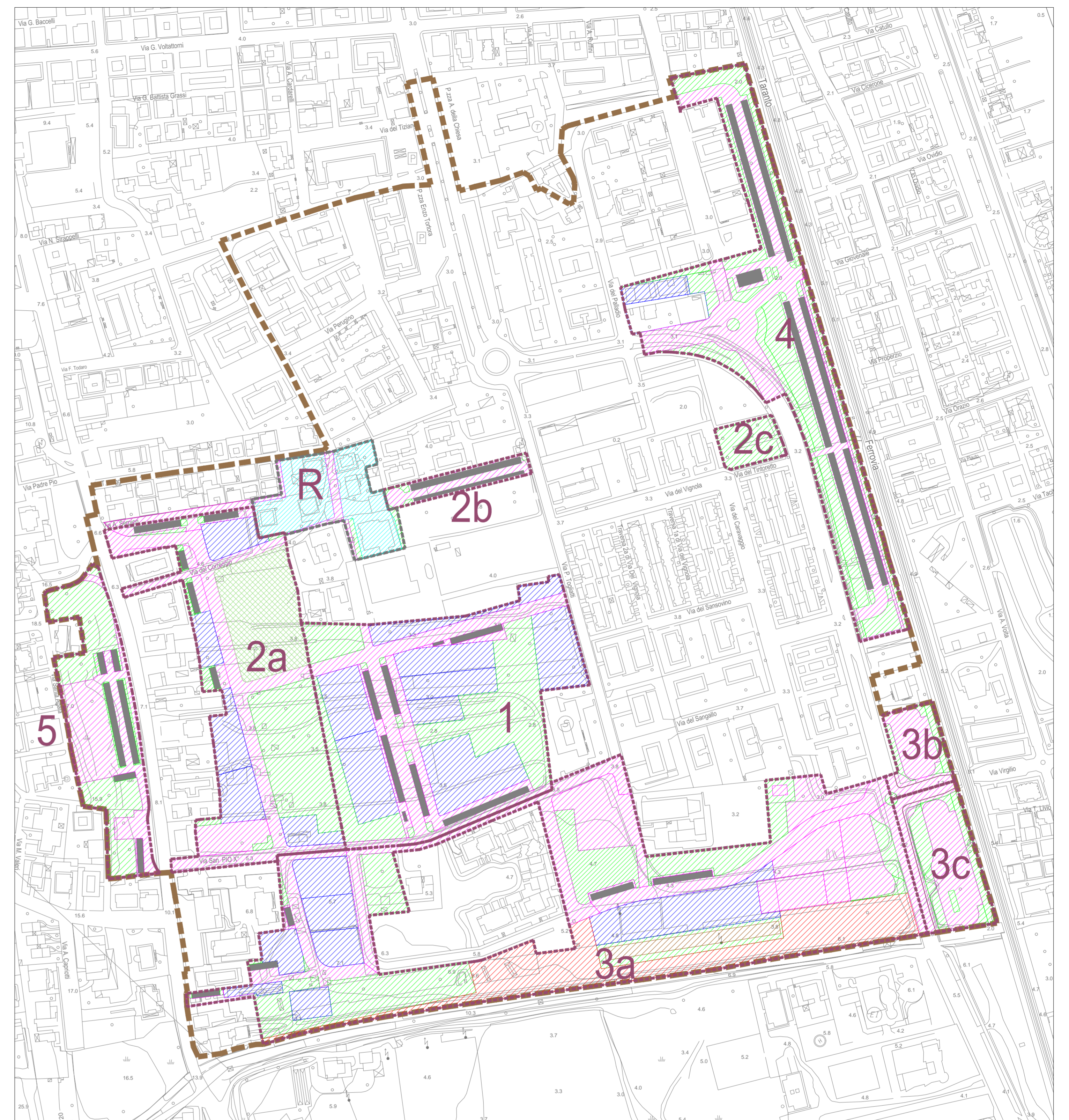
USO DEI SUOLI - STATO POST OPERAM