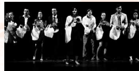
Teatro Concordia San Benedetto del Tronto SABATO 20 SETTEMBRE - ore 23

La rielaborazione contemporanea del mito di Medea come strumento per raccontare una terra ferita e abbandonata: la Basilicata. La regione italiana più povera ma più ricca di petrolio e che ha il più alto incremento del tasso tumorale. Una contaminazione di formule stilistiche, per narrare una situazione che, impiantandosi negli archetipi della storia lucana, trova ragion d'essere nel suo presente. Così come Medea uccide i suoi figli e si fa metafora dell'accettazione della rovina, il popolo lucano combatte ogni giorno contro lo straniero, il colonizzatore e si ribella a quell'amore tradito che, diradando la demografia e dilaniando il territorio, uccide senza scandalo uomini, donne e bambini. Lo straniero-invasore è l'amante infedele che non restituisce il "bacio" ricevuto, che non mantiene la promessa d'amore, di crescita e di lavoro a un paese che regala ricchezza per ricevere in cambio povertà. Una parodia cattiva, che guarda, con sgarbo farsesco, il riflesso di un'ostilità rappresa, un mondo di poca esultanza e molto dolore, una lotta fra forze opposte, in cui il più forte vince sempre sul più debole.