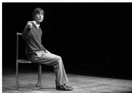
Teatro Concordia San Benedetto del Tronto SABATO 20 SETTEMBRE - ore 21