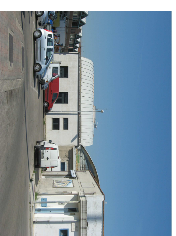
fronte est via V. DE GAMMA