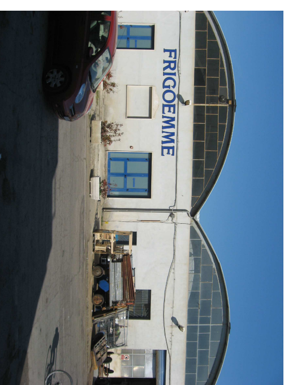
Fronte sud via E. Dandolo - schiera 1