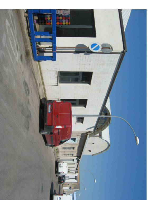
fronte est via A. VESPUCCI