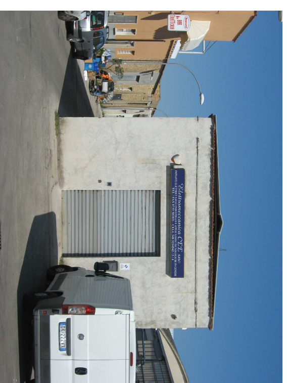
Fronte sud via E. Dandolo - schiera 3