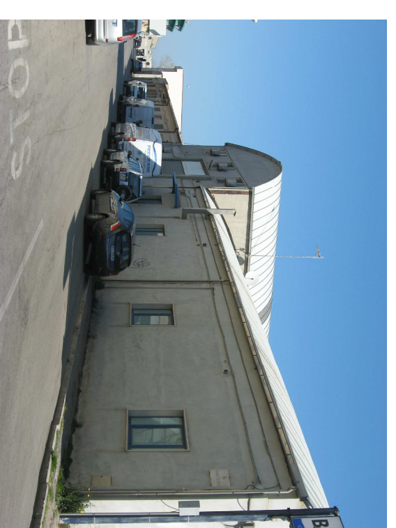
fronte ovest via A. VESPUCCI