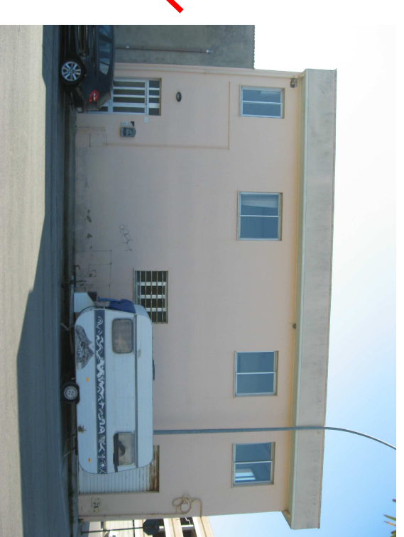
Fronte nord via A. Pigafetta - schiera 1