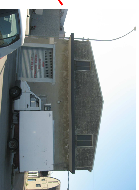
Fronte nord via A. Pigafetta - schiera 2