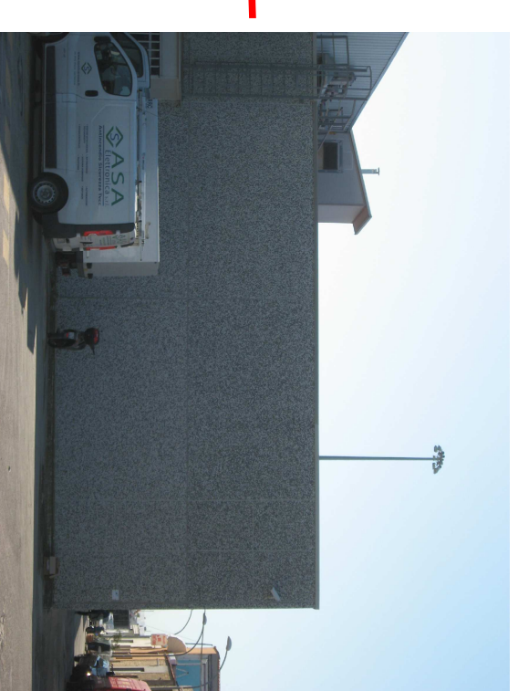
Fronte nord via A. Pigafetta - schiera 3