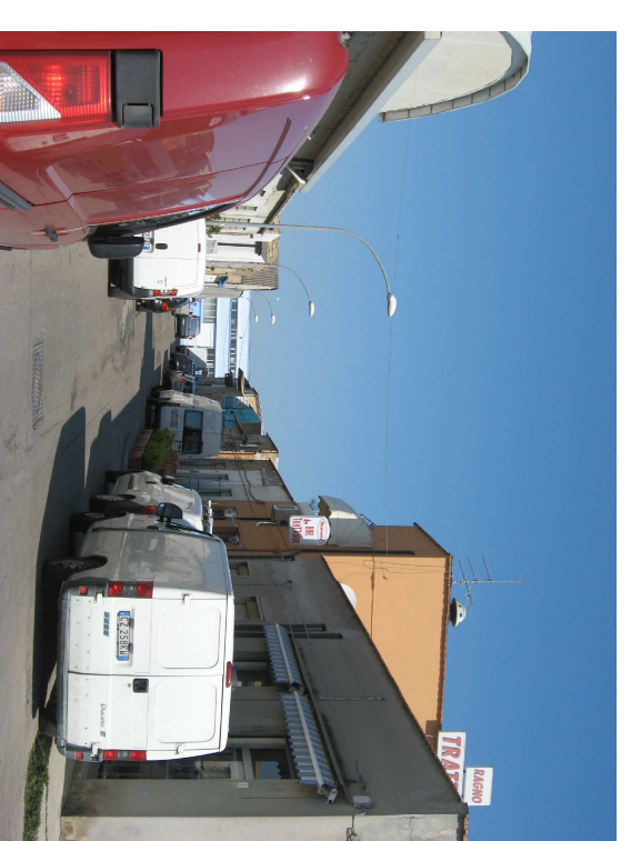
fronte ovest via M. POLO