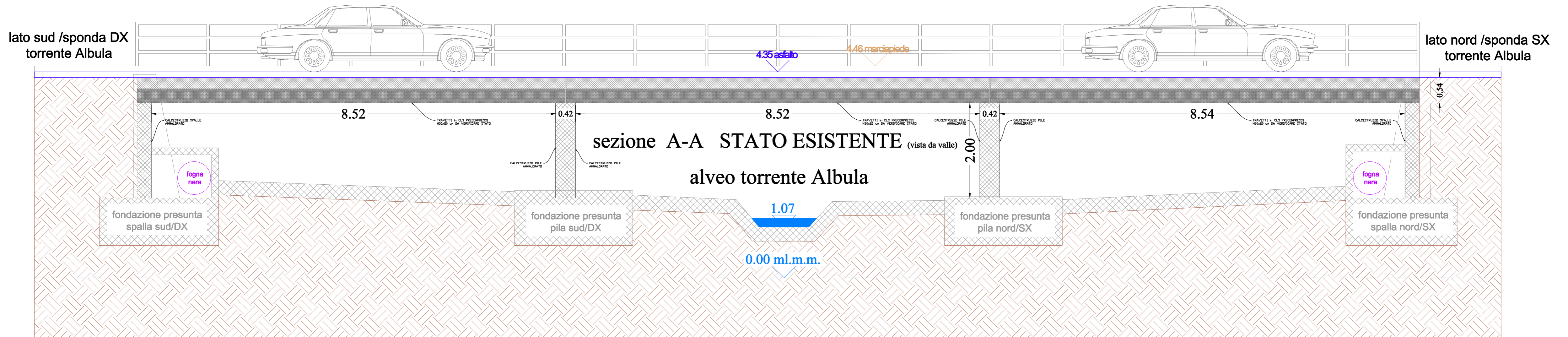
SEZIONI scala 1:50

NOTA BENE: LE TUBAZIONI SPOSTATE DOVRANNO ESSERE OPPORTUNAMENTE ALLACCIATE ALLE LINEE ESISTENTI IN CORRISPONDENZA DELLE SPALLE