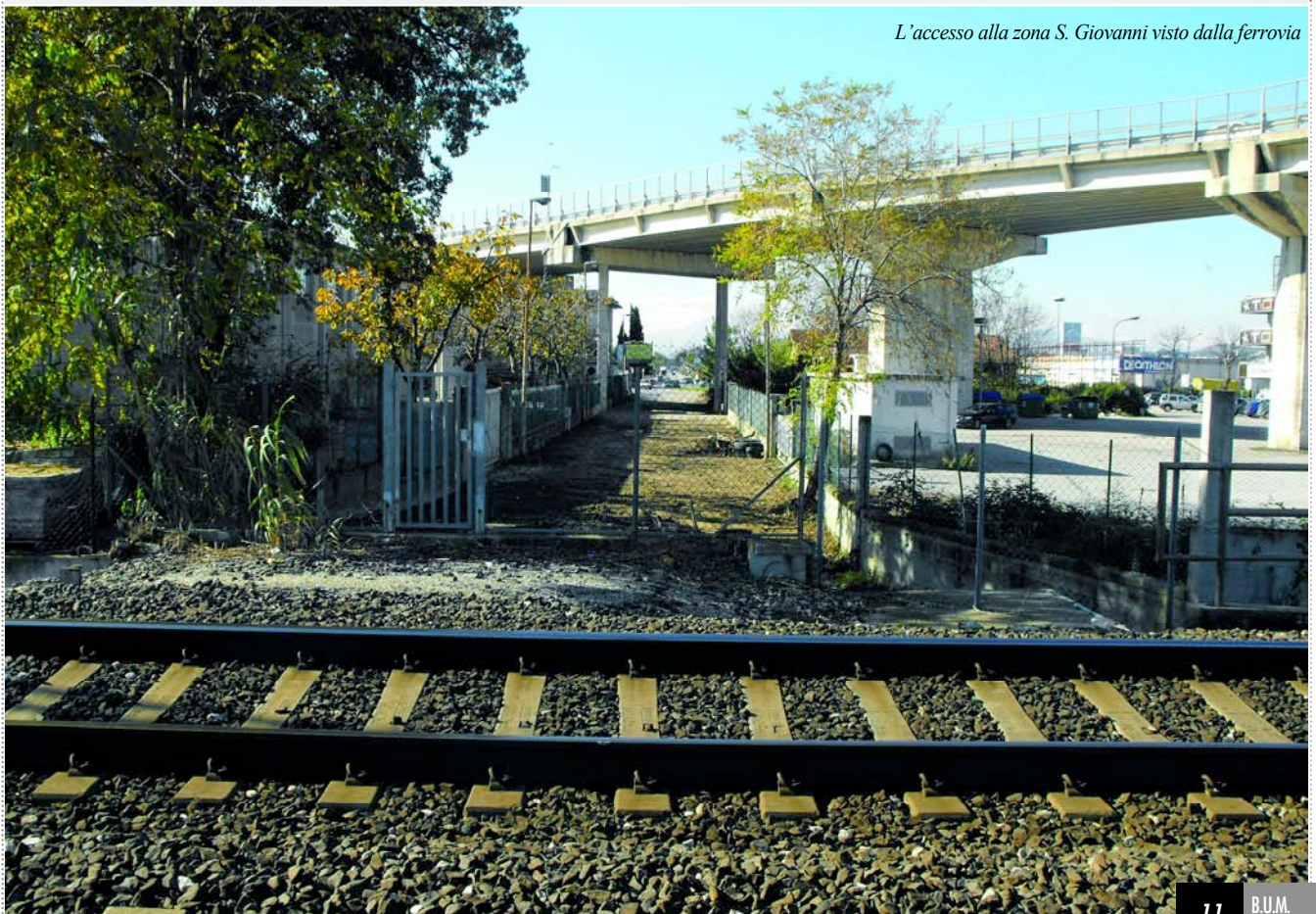
L'accesso alla zona S. Giovanni visto dalla ferrovia

La convenzione prevede una stretta tempistica: pertanto, si prevede che l'iter sarà completato per la prossima estate. Occorrerà poi un paio d'anni tra assegnazione dei lavori e loro completamento.