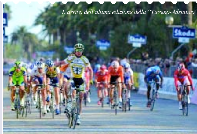
L'arrivo dell'ultima edizione della "Tirreno-Adriatico"

20-21 Marzo - Seminario Nazionale Traditional Kung Fu Association Palasport B. Spica