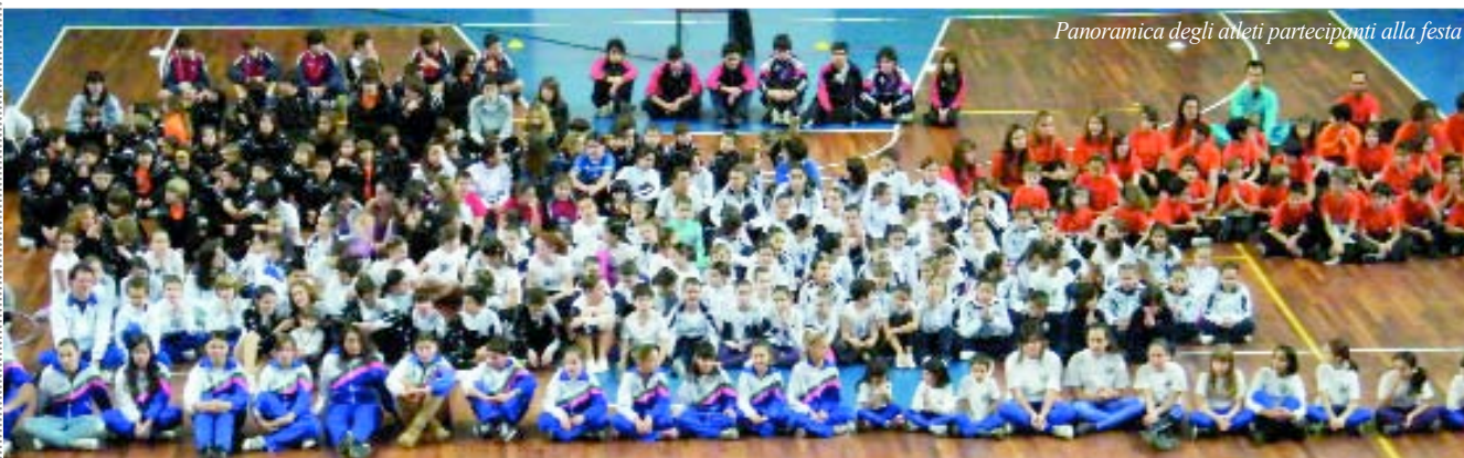
Panoramica degli atleti partecipanti alla festa

All'interno del Palasport, durante le feste, è stata allestita una mostra di duemila disegni realizzati dagli studenti dei tre circoli didattici cittadini nell'ambito della campagna "Giochiamo Pulito". La mostra sarà trasferita presso lo Stadio "Riviera delle Palme".