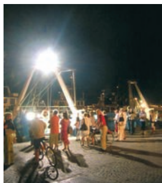
la ripresa della pesca, lo scorso 26 agosto