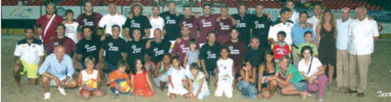
Le squadre finaliste del Torneo, con i alcuni bambini dell'Istituto "Santa Gemma"

Il 1° Trofeo dei Quartieri di Beach Soccer, che si è svolto da lunedì 23 a venerdì 27 luglio, nella Beach Arena sulla spiaggia all'altezza dell'ex camping (v. il Bum di agosto-settembre), è stato una nuova intensa festa dello