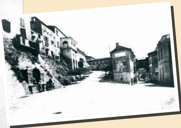
nella foto: Via Elio Fileni - Archivio URP in copertina: Via Elio Fileni

Stampa: Fast Edit Acquaviva Picena (AP) tel. e fax 0735.765035