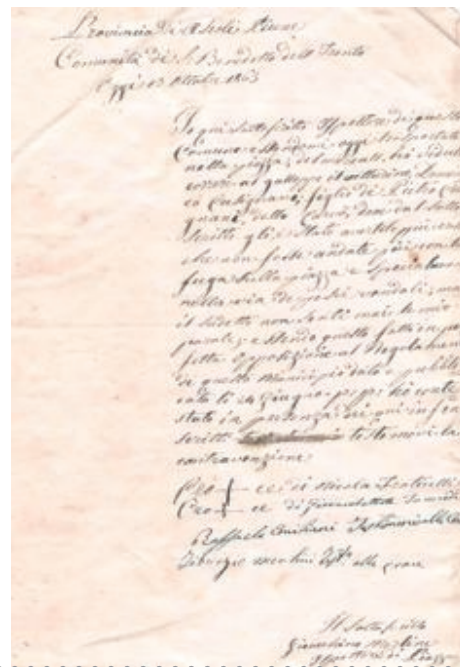
Archivio storico comunale, B. 20.36, anno 1863