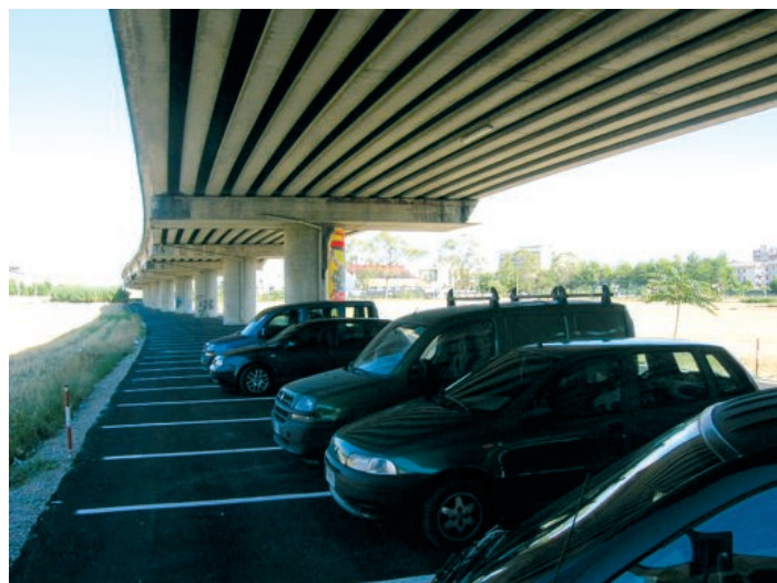
i due parcheggi realizzati, per i camper (viale dello Sport, in alto) e le auto (via Mare)

Un importante intervento di riqualificazione, infine, è previsto per il mercatino di via Montebello . La strada (da piazza Garibaldi a via La Spezia) sarà chiusa al traffico. L'attuale copertura sarà smantellata e realizzata invece una tensostruttura polivalente, più larga dell'attuale, utilizzabile anche per manifestazioni nel quartiere, oltre che per un numero invariato di postazioni per il commercio ambulante.