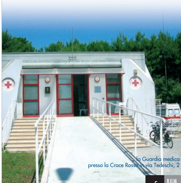
La Guardia medica presso la Croce Rossa in via Tedeschi, 2

In caso di effettiva urgenza, dalle ore 20 alle 8 di tutti i giorni, dalle 14 alle 20 dei prefestivi e dalle 8 alle 20 di sabato e festivi, l'assistenza medica è garantita dai medici di Continuità assistenziale alle stesse tariffe della Guardia medica turistica. L'accesso al Pronto soccorso è gratuito per i pazienti in condizioni di emergenza, negli altri casi le visite sono a pagamento (da 16,50 a 36,30 euro).