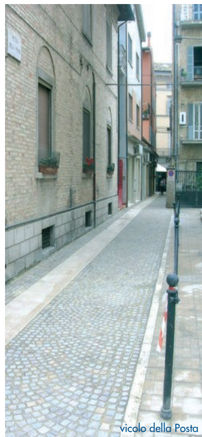
vicolo della Posta

dirigente del settore Progettazione opere pubbliche del Comune. Totale complessivo di questi lavori: 630 mila euro.