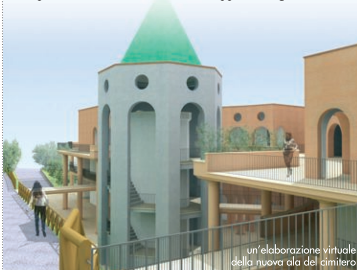
un'elaborazione virtuale della nuova ala del cimitero