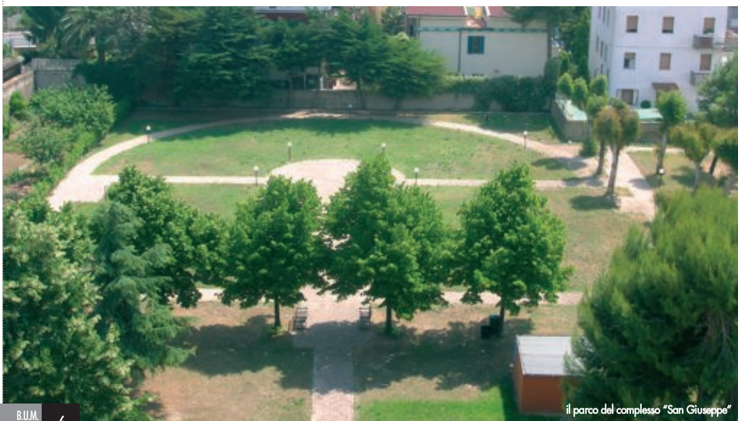
il parco del complesso "San Giuseppe"

Le rette variano in funzione del reddito delle famiglie. Le richieste di ammissione al centro vengono raccolte al secondo piano del Comune (viale De Gasperi 124, tel. 0735.794552) e vengono poi valutate da una "Unità valutativa distrettuale", composta da un medico del Distretto sanitario della Zona n. 12, dal medico di famiglia della persona che intende usufruire del centro, da un infermiere, dall'assistente sociale del Comune e da un medico specialista in geriatria o neurologia.