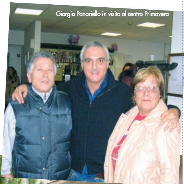
Giorgio Panariello in visita al centro Primavera