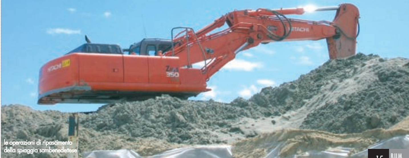
le operazioni di ripascimento della spiaggia sambenedettese