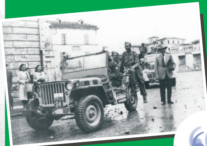
nella foto: i polacchi a San Benedetto in copertina: il manifesto per il 14° festival Ferré realizzato da Ugo Nespolo

Stampa: Grafiche Martintype Colonnella (Te) tel. 0861.748980 fax 748994