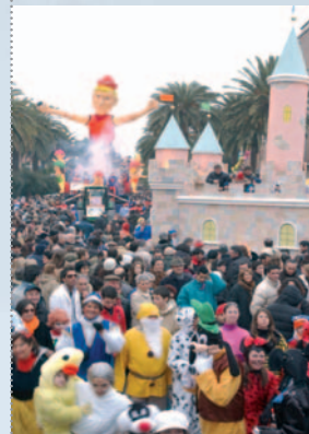
In copertina: foto di Adriano Cellini

tel.0735.892211 telefax 0735.892241 oppure all'A.I.P.A. tel.0735.86691 - 0735.785021 telefax 0735.780438.