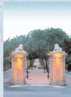
immagine di copertina: Via Marradi (la porta dei leoni)

Per ogni informazione, per ritirare bandi e modelli di domanda rivolgersi al Servizio Gestione del Personale (tel. 0735 - 794509 / 794513), all'Ufficio Relazioni con il Pubblico (tel. 0735 - 794405 / 794430) o all' Informagiovani - Via Romagna, 6 (tel. e fax 0735 - 781689). Copia del bando e fac-simile di domanda sono disponibili anche sul sito del Comune www.comune.san-benedetto-del-tronto.ap.it .