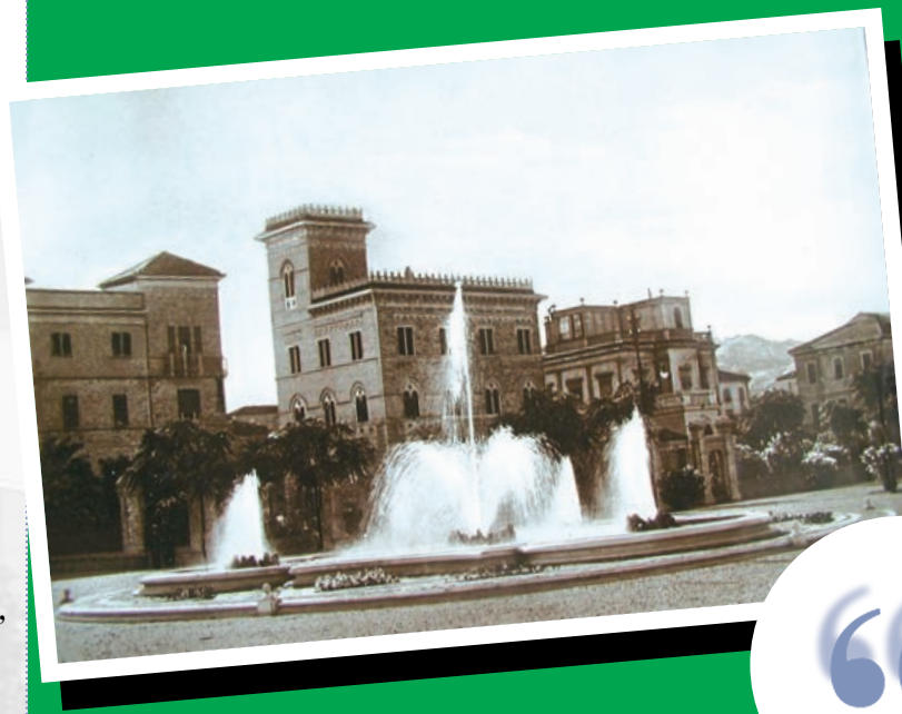
nella foto: la rotonda, primi del '900

Stampa: Grafiche Martintype Colonnella (Te) tel. 0861.748980 fax 748994