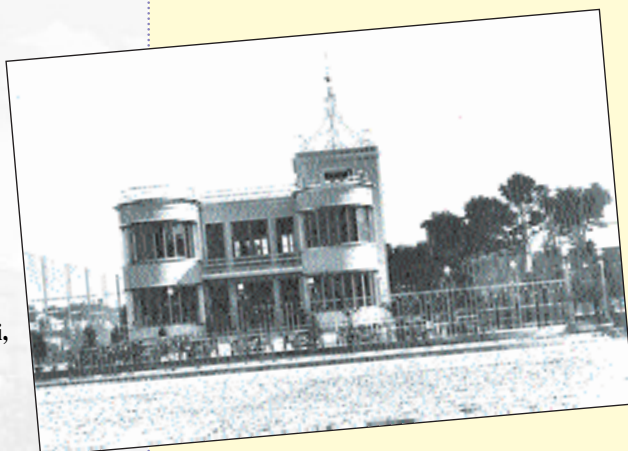
in copertina: Piazza "Bambini del Mondo"

Concessionaria di pubblicità: Sonia Roscioli Communication tel. 0735.591154 - port. 393.6921090 Stampa: Fast Edit - Acquaviva Picena (AP) tel. e fax 0735.765035