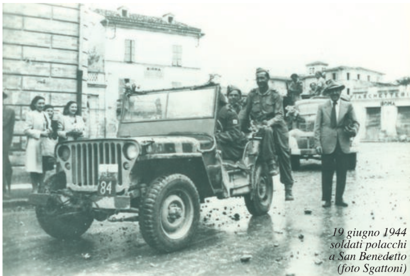
19 giugno 1944 soldati polacchi a San Benedetto

Molti giovani seguirono il loro esempio raggiungendo in breve tempo le 120 unità partecipando attivamente alla lotta della Resistenza in vari luoghi della provincia di Ascoli Piceno, cooperando attivamente nell'assistenza ai profughi ed a latitanti prigionieri di guerra. Particolarmente significativa l'operazione compiuta nella notte del 4 ottobre 1943, coordinata dal tenente Carlo Alberto Dalla Chiesa, dal guardiamarina Nebbia di San Benedetto e da altri partigiani locali, con trasferimento di 15