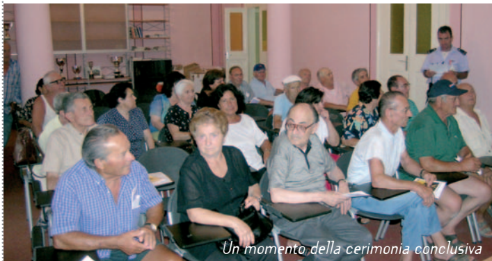
Un momento della cerimonia conclusiva

Si sono conclusi il 5 luglio i 2 corsi gratuiti che la Polizia municipale ha organizzato e realizzato a favore di quanti, maggiorenni privi di patente di guida, avessero necessità di ottenere il certificato di idoneità (cosiddetto “patentino”) per poter condurre un ciclomotore il cui obbligo, secondo le norme ora modificate, sarebbe dovuto decorrere dal 18 luglio 2005. Come programmato i partecipanti ai due corsi sono stati individuati dando la precedenza ai più anziani. Le domande presentate sono state infatti 136, molte più dei posti disponibili per i corsi iniziati a giugno.