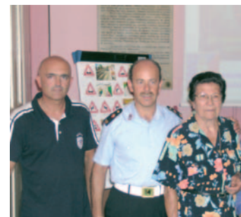
Gli uomini della Polizia municipale con un'allieva

In considerazione del fatto che non sarà più necessario sottoporsi ad esame per il conseguimento del “patentino” per quanti siano maggiorenni al prossimo 30 settembre, non si prevede l'organizzazione di ulteriori corsi di preparazione e di ciò sarà data comunicazione a tutti coloro che hanno fatto domanda di partecipazione ai corsi organizzati dal Comando di Polizia Municipale. Ciò non toglie che per il futuro, considerata l'ottima riuscita dell'iniziativa, la Polizia municipale, oltre al consueto impegno per l'educazione stradale nelle scuole, possa organizzare attività di formazione e aggiornamento sul tema della sicurezza stradale anche a favore degli adulti, con particolare riguardo ai conducenti più anziani. Per questo, già a quanti hanno presentato istanza, sarà comunque richiesto se intendano ugualmente dare la loro disponibilità per la partecipazione a tali future attività.