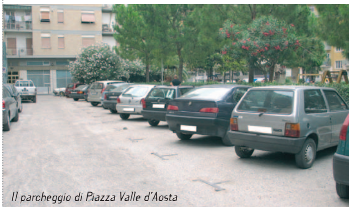
Il parcheggio di Piazza Valle d'Aosta

In entrambi i casi il costo è di 0,60 euro per ora di sosta: non saranno validi i permessi utilizzati dai cittadini residenti in quanto le nuove aree sono fuori dalle zone in cui queste autorizzazioni sono valide.