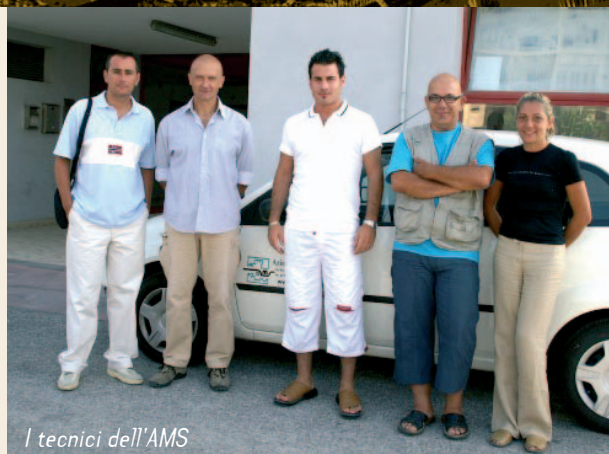
I tecnici dell'AMS

Nella foto qui accanto, gli addetti dell'Azienda Multiservizi che si recano nelle abitazioni. Tutti sono dotati