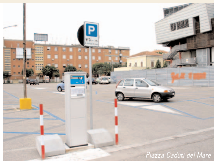
Piazza Caduti del Mare

I posti auto attualmente disponibili sono 80 ma, quando termineranno i lavori di riqualificazione del vicino Istituto Alber-