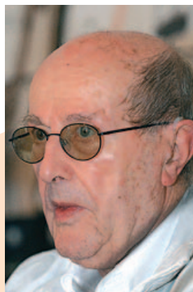
Manoel De Oliveira