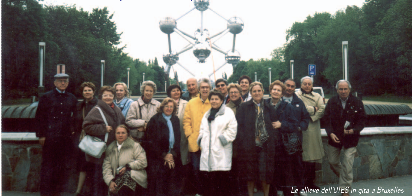
Le allieve dell'UTES in gita a Bruxelles

L'UTES da inizio al 17° anno accademico: ma un anno fortunato, non solo perché si sintonizzerà sull'onda del successo dei corsi estivi nel segno della continuità, ma sarà proiettato sempre di più verso l'Educazione Permanente nel segno dell'innovazione e della rispondenza ai tempi ed alle esigenze del mondo di oggi.