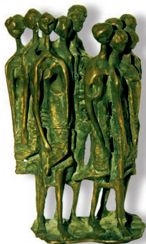
Viandanti scultura di Giuseppe Marinucci

Promossa dall'assessorato alla Cultura del Comune di San Benedetto, è aperta fino a domenica 31 agosto, presso la Palazzina Azzurra, la mostra di sculture di Giuseppe Marinucci e Mauro Crocetta, visitabile gratuitamente dal martedì alla domenica dalle ore 18 alle 24. Verranno esposte circa sessanta opere, che rappresentano una sorta di percorso paradigmatico dell'opera