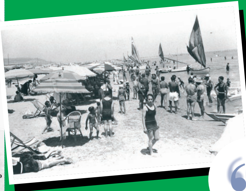
nella foto: la spiaggia sambenedettese ai primi del '900 (archivio URP)

Concessionaria di pubblicità: SR Communication tel. 0735.591154 - port. 393.6921090 Stampa: Grafiche Martintype Colonnella (Te) tel. 0861.748980 fax 748994