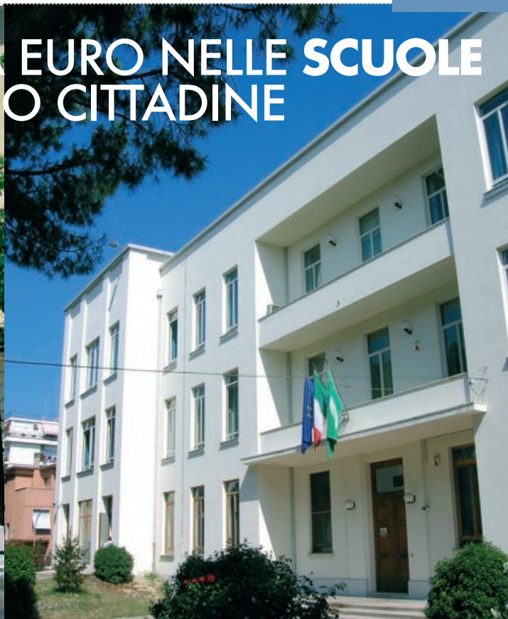
la scuola "Caselli" di via Moretti

Nel corso dell'estate si svolge un piano di lavori negli edifici delle scuole dell'obbligo cittadine, per una spesa di 200 mila euro da parte del Comune, tra tinteggiature, opere edili e di cartongesso, opere elettriche, idrauliche, "da fabbro", arredi scolastici e altre. Com'è noto, il Comune ha competenza appunto sugli edifici scolastici degli istituti dell'obbligo, mentre la Provincia si occupa di quelli relativi alle scuole superiori. Le scuole