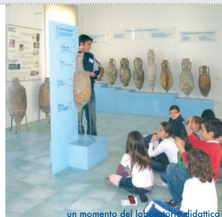
un momento del laboratorio didattico

I bambini hanno realizzato delle piccole anfore con il das, personalizzandole alcune con le conchiglie, alcune decorate con la tempera, e hanno disegnato degli scenari introducendo gli stessi manufatti, colorando il tutto con sabbia, sassolini e conchiglie. Per gli operatori è stata una bella esperienza collaborare con i ragazzi e le insegnanti, persone disponibili e qualificate e nello stes-