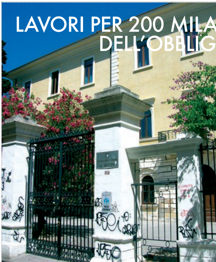
la scuola media "Sacconi"