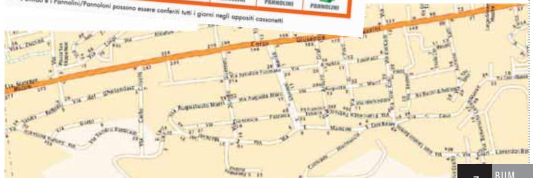
Orari e giorni di conferimento a monte della Statale Adriatica