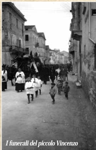
I funerali del piccolo Vincenzo

Ma lei lo amò subito quel teschio, come aveva amato lo zio fanciullo nella bella grandissima foto appesa alla parete della saletta, per tutto il perio-