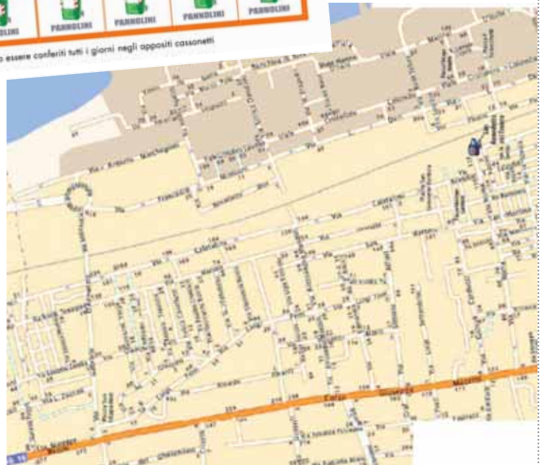
Orari e giorni di conferimento ad est della Statale Adriatica