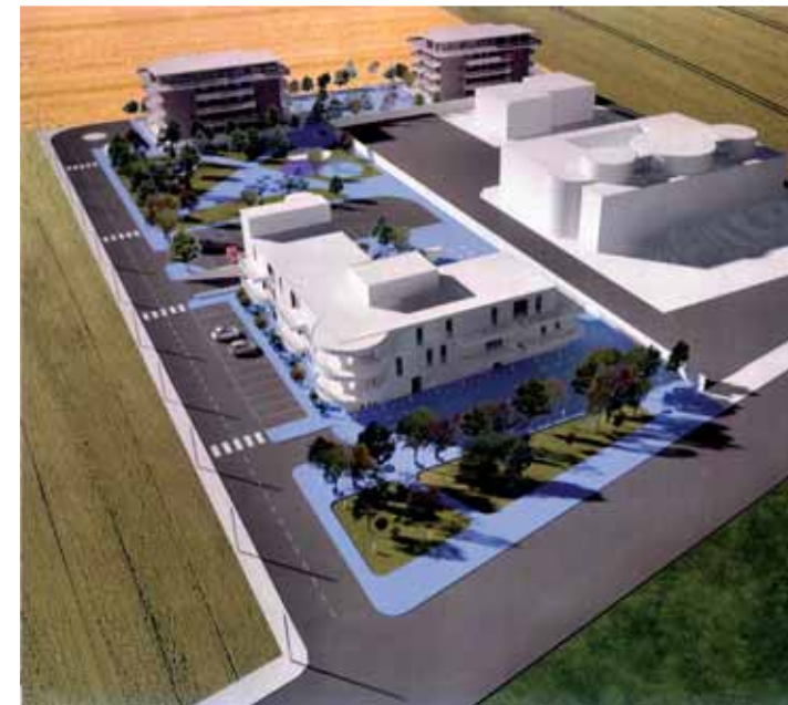
Alcune ricostruzioni al computer di come si presenterà l'area

Nello specifico saranno completate tre palazzine esistenti con accesso da Viale dello Sport, per un volume totale di 16.057 mc; saranno realizzati altresì verde attrezzato, parcheggi pubblici, aree per per-