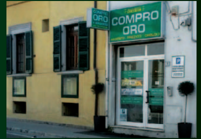
VIA SILVIO PELLICO 1

Via Mentana 6 - San Benedetto del Tronto - angolo viale S. Moretti (angolo isola pedonale) tel. 0735 583895