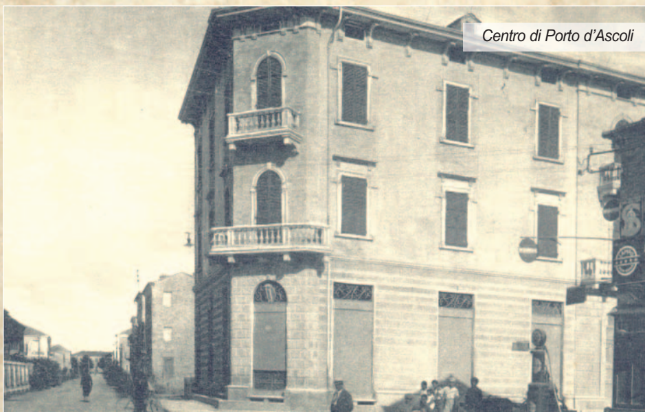
Centro di Porto d'Ascoli

dal canto suo, percependo le potenzialità della frazione rispetto al proprio capoluogo e volendo in qualche modo andare incontro agli abitanti di Porto d'Ascoli, iniziò ad elaborare, a fronte dello sviluppo abitativo e di densità, un piano di ampliamento che disciplinasse sulle nuove costruzioni, migliorasse la viabilità - su tutte quella della Salaria e dell'Adriatica - rafforzasse le vie di comunicazioni verso il mare, creasse aree per attività commerciali e piazze, oltre a voler mettere mano ai pubblici servizi quali la rete fognaria, l'acqua potabile e la pubblica illuminazione. Questo piano, progettato, non fu reso esecutivo. Per effetto della domanda avanzata da 484 "contribuenti" residente tra il Ragnola