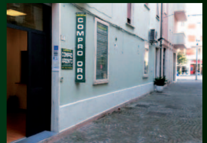
VIA MENTANA 6