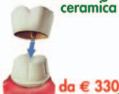
Corona lega ceramica