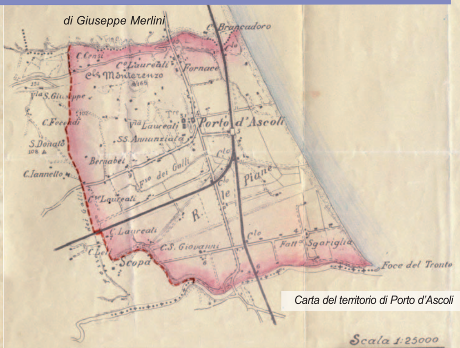
Carta del territorio di Porto d'Ascoli

Per una maggiore vicinanza e contiguità territoriale e soprattutto per affinità industriale, commerciale e balneare, tornava