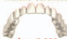
Ponte Circolare Metallo-Ceramica