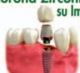
Corona Zirconio su Impianto