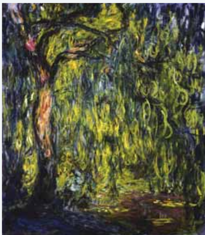
Salici piangenti in un famoso dipinto di Claude Monet del 1918

"Una volta mi trovavo a Praga con un'amica, ci perdimmo fra le vie del centro e andiamo un po' nel panico", racconta una redattrice. "C'era una guglia di una chiesa, più alta delle altre, e continuavamo a vederla spesso nei nostri giri. Abbiamo capito che poteva aiutarci se la usavamo come punto di riferimento. Abbiamo ritrovato la strada grazie ad essa. Senza andare in cima alla guglia, e senza nemmeno visitare la cattedrale, poi. Ci mancò il tempo. Ma quella guglia esisteva, ce ne siamo accorti, e proprio per questo ci ha aiutato".