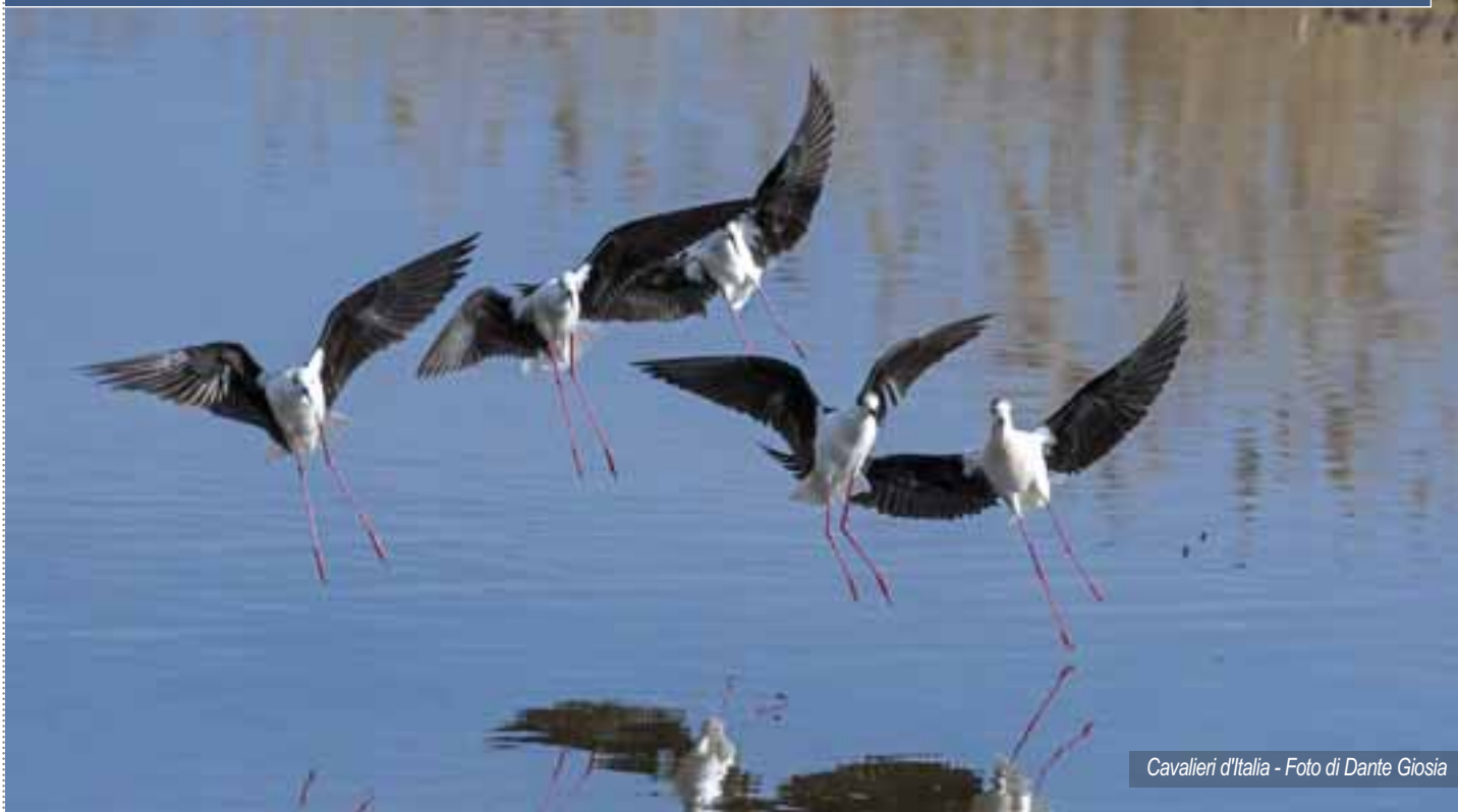
Cavalieri d'Italia

In queste settimane difficili, molti di noi hanno avuto modo di vedere foto e video incredibili sulla natura che riprende i suoi spazi durante il lockdown e sulla rigenerazione di ambienti naturali in seguito al blocco delle attività umane.