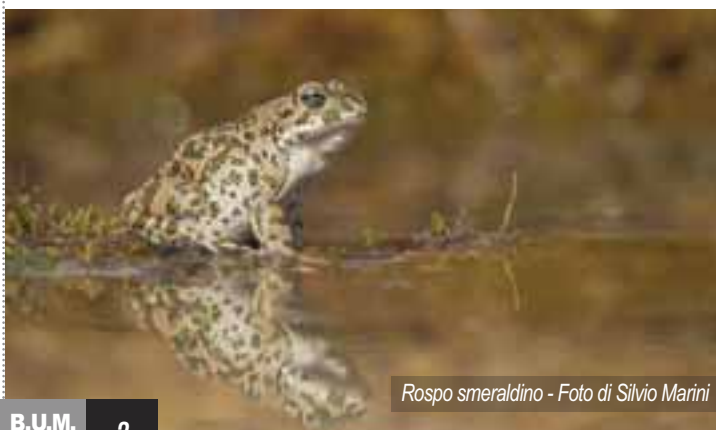
Rospo smeraldino

Tutto ciò che stiamo osservando costituisce una preziosa lezione che deve spingerci a riflettere. Se riusciamo a far tesoro di questo momento non avremo sofferto invano e saremo pronti per una...ripartenza più sostenibile!