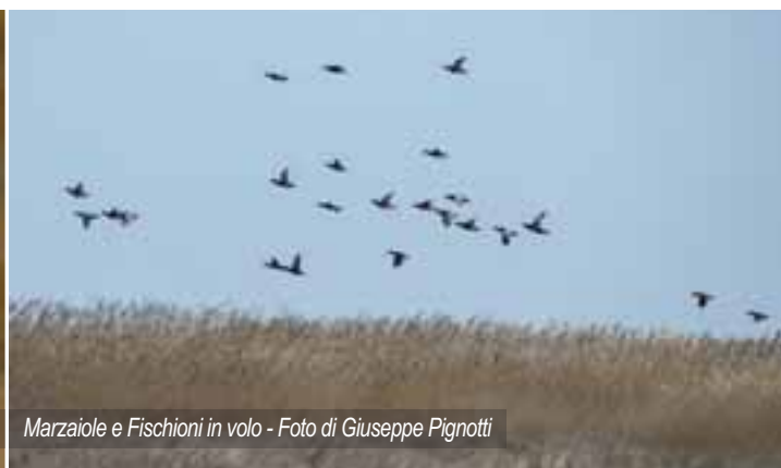
Marzaiole e Fischioni in volo