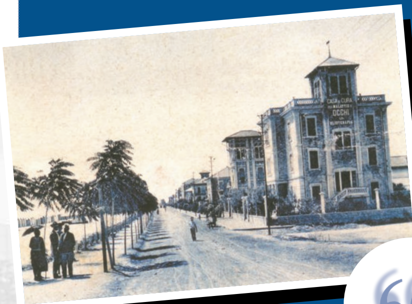
il lungomare a corsia unica a sud del torrente Albula, 1931 (archivio URP) in copertina: manifesto per l'apertura della Pinacoteca del mare

sociali, compresi quelli per il diritto allo studio e quello per l'iscrizione dei bambini ai nidi d'infanzia per l'anno 2009/2010. Entra poi nel vivo il "Piano casa", tramite un bando per il recupero del patrimonio edilizio pubblico e privato, dietro destinazione di una parte degli immobili ad affitti calmierati. L'arrivo della stagione primaverile-estiva non si caratterizza insomma, come avviene alla fine di un anno scolastico, per una sorta di "rompete le righe", ma al contrario per un impegno costante verso i problemi della città, specie in un periodo delicato come quello attuale.